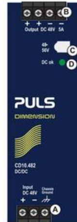
Fig. 10-1 Front side