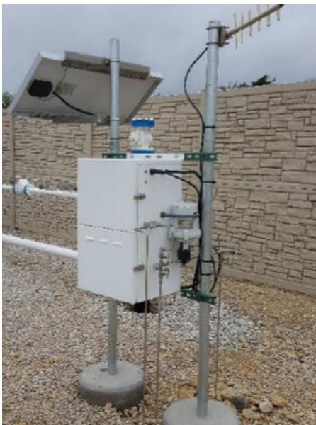
PAX 1 Linear actuator